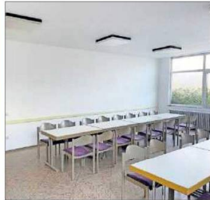
Bei den Freiwilligentagen verschönert: Gemeindezentrum.

oder Erbpacht an einen Interessenten geschehen oder durch die vertragliche Übergabe an den Verein Pro Pauluskirche, der die Betriebs- und Unterhaltungskosten des Sakralgebäudes übernimmt. Eine Entscheidung soll bis Ende 2025 erfolgen.